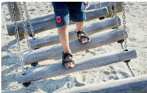
De ansatte i barnehage, skole og SFO kan skape sammenheng ved å være brobyggere mellom institusjonene. (Thoresen, Aukland 2020)

Målgruppen er alle barnehager, barneskoler og SFO i Sola. For å oppnå en god sammenheng for barnet i overgangen må barnehage – skole og SFO ha god nok kunnskap om hverandres profesjon, avklare forventninger og ha faste rammer med møtepunkt for dialog. Foreldrene er en ressurs og en viktig samarbeidspartner i dette arbeidet. SFO er ofte den første arenaen barnet møter som skolestarter. SFO står i en særstilling i mellomrommet mellom barnehage og skole, denne særstillingen og SFO sin betydning i overgangen skal få større kraft i Sola.